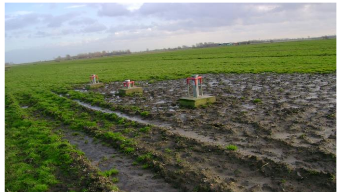
Abbildung 2: Messstellen im landwirtschaftlich geprägten Umfeld

Die zum Teil komplizierten geologischen, hydraulischen und hydrologischen Verhältnisse in Niedersachsen sind bei der Festlegung geeigneter aussagefähiger Messstellenstandorte zu berücksichtigen. So müssen an einem Standort Grundwasserleiter mehrerer Grundwasserstockwerke mit Messstellen unterschiedlicher Filterlage erfasst werden, die durch gering durchlässige Schichten getrennt sind oder zwischen denen das Wasser über "geologische Fenster" in den Zwischenschichten und entsprechende hydraulische Kontakte ausgetauscht wird. Zudem kann bei mächtigen Grundwasserleitern (ohne trennende Schichten) eine Verteilung von mehreren Filtern über die Tiefe sinnvoll sein.