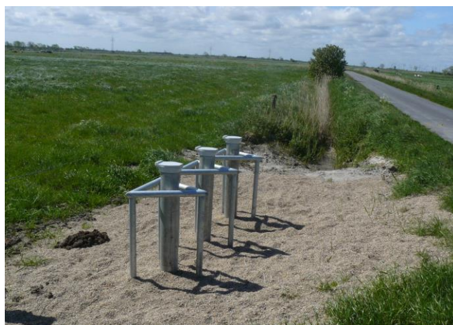
Abbildung 1: Messstellen im Grünland

Die in der vorliegenden Messnetzkonzeption festgelegten Rahmenbedingungen schaffen die Voraussetzung, dass von den beteiligten Dienststellen der niedersächsischen Wasserwirtschaftsverwaltung die Untersuchungen wie bisher nach identischen Kriterien durchgeführt und die Ergebnisse vergleichbar ausgewertet und dargestellt werden.