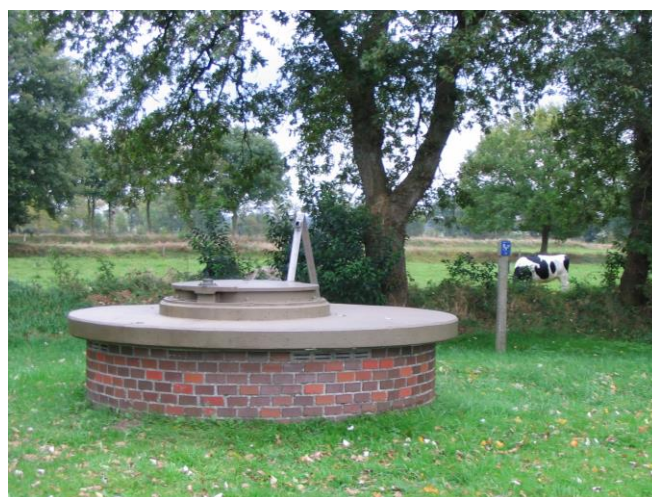
Abbildung 4: Förderbrunnen im Wasserwerk Sandelermöns (Landkreis Friesland)

Die Ergebnisse der Grundwasserstandsüberwachung und die gewonnenen Erkenntnisse werden zudem unter dem Aspekt der Optimierung des Standsmessnetzes ausgewertet.