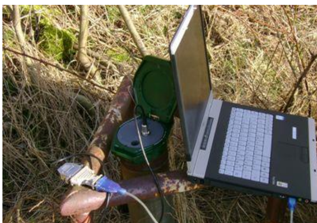
Abbildung 6: Auslesung eines Datenloggers im Gelände

Die Festlegung des Messturnus und der Einsatz von registrierenden Messgeräten liegen im Ermessen der zuständigen NLWKN Betriebsstelle. Ein verkürzter Messturnus oder eine kontinuierliche Beobachtung durch Datenlogger, ist insbesondere bei Messstellen mit häufigen und starken Schwankungen des Wasserstandes, wie z.B. im Festgestein, in der tidebeeinflussten Küstenregion, in unmittelbarer Nähe zu Fließgewässern oder bei Porengrundwasserleitern mit geringmächtigen und durchlässigen Deckschichten sinnvoll.