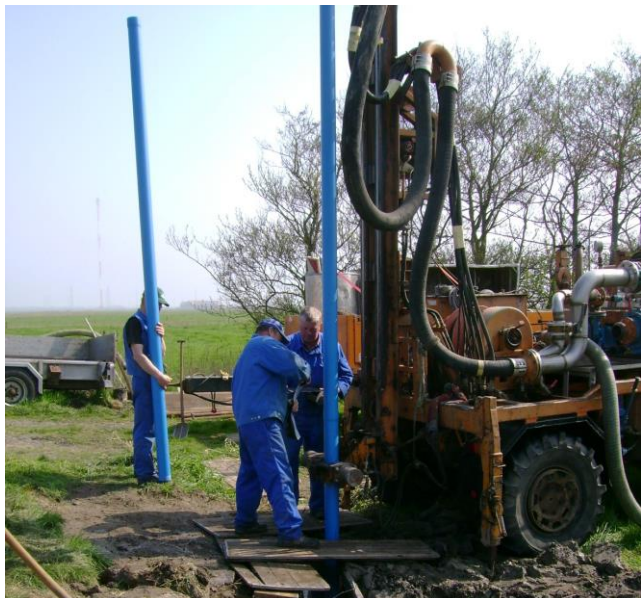
Abbildung 7: Neubau einer Grundwassermessstelle