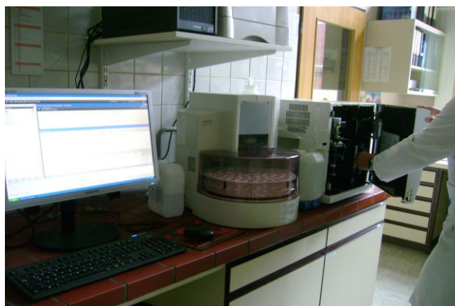
Abbildung 10: Probenanalytik im Labor

Für die erstmalige Untersuchung von Grundwassermessstellen (z.B. Neubauten oder andere bisher bezüglich der Grundwasserbeschaffenheit unbekannte Messstellen) ist der vollständige Untersuchungsumfang bestehend aus Grund- und Ergänzungsprogramm sowie der Untersuchung auf Pflanzenschutzmittel vorzusehen. Die anschließend regelmäßig wiederkehrenden Untersuchungen erfolgen in Abhängigkeit der Zuordnung zu den Messprogrammen (siehe Anlage 1). Bei der Beprobung wird neben den Pflichtparametern der einzelnen Programme (in Anlage 1 fett markiert) der gesamte Parameterumfang des Grund- bzw. Ergänzungsprogramms des Messprogramms Grundwasser Güte durchgeführt, um durch die einheitliche Analytik im Rahmen aller Messprogramme eine Vereinfachung hinsichtlich der Probenahme und Analytik zu erzielen und aussagekräftige Analysedaten zu gewinnen.