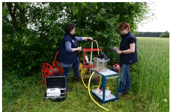
Abbildung 9: Grundwasserprobenahme im Gelände

Die im Rahmen des Gütemessnetzes Grundwasser zu untersuchenden Proben der landeseigenen Messstellen sind grundsätzlich Einzelproben. Probenahme und Untersuchung erfolgen in der Regel durch die jeweils regional zuständigen Betriebsstellen des NLWKN.