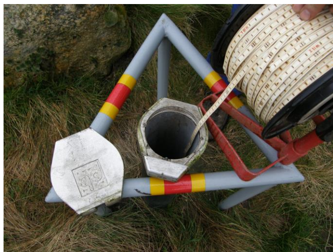
Abbildung 3: Grundwasserstandsmessung mittels Lichtlot

Die Beobachtung der Grundwasserstände dient im Wesentlichen der Erfassung der Wasservorräte in den Grundwasserleitern und ihrer zeitlichen Veränderung sowie der Überwachung der räumlichen Auswirkungen von Grundwassernutzungen. Diese Kenntnisse sind notwendige Voraussetzungen für eine schonende, bedarfsgerechte Bewirtschaftung unserer Grundwasservorkommen und für wasserwirtschaftliche Planungen. Grundwassernutzungen wie Entnahmen für Trinkwasser, Brauchwasser oder Erdwärme benötigen diese Daten. Auch andere Bereiche wie z.B. Tiefbau, Bergbau, Bodenabbau, Gewässerbau oder Naturschutz profitieren von dem umfangreichen und historischen Datenbestand.