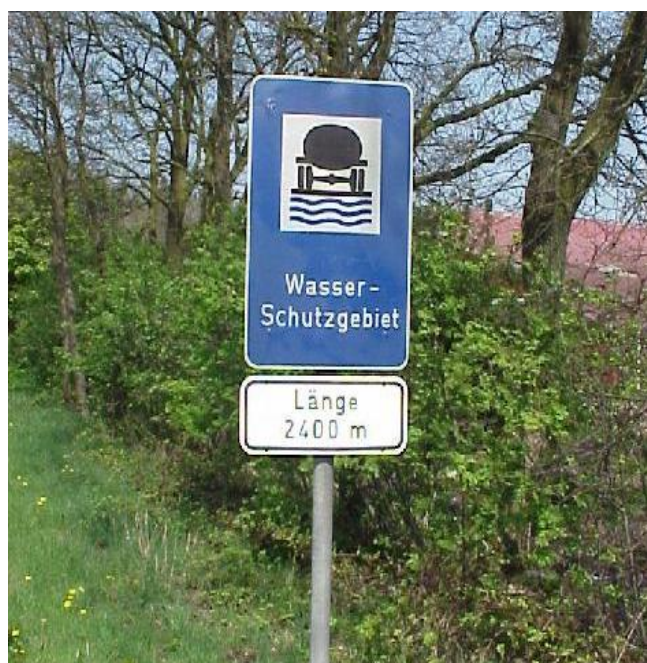
Abbildung 8: Hinweisschild Wasserschutzgebiet

Die im Zuge der Eigenüberwachung des Rohwassers sowie aus der Beobachtung der Vorfeldmessstellen erhobenen Daten dienen den Wasserversorgungsunternehmen zur Qualitätssicherung. Die Daten sollen darüber hinaus zur Ergänzung der Datengrundlage des landesweiten Grundwassergütemessnetzes genutzt und deshalb zentral zusammengeführt werden. Dazu sind die Stammdaten und die Untersuchungsergebnisse der Rohwasser- und Vorfeldmessstellen dem Niedersächsischen Landesbetrieb für Wasserwirtschaft, Küsten- und Naturschutz (NLWKN) zu übermitteln.