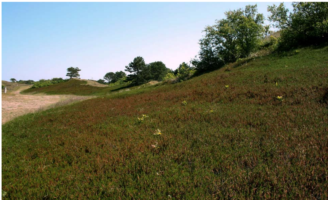
Abb. 1: Küstendünen mit Krähenbeerheide auf Spiekeroog