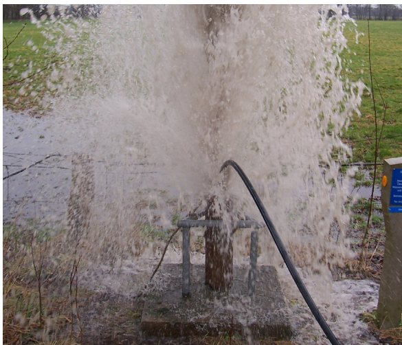
Spülen einer Grundwassermessstelle