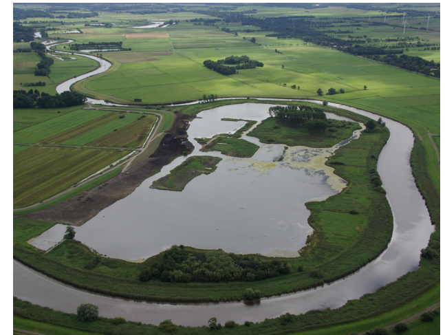
Rückdeichung Ostebogen Schönau

Ein weiteres wichtiges Aufgabenfeld ist die Öl- und Schadstoffunfallbekämpfung, für die der Geschäftsbereich Spezialgerät und ausgebildetes Personal bereithält.