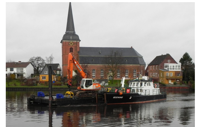
Der Schlepper Seehund im Einsatz an der Oste

Auf Grund der Küstenlage stehen Deich- und Hochwasser- bzw. Sturmflutschutzmaßnahmen bei den Planungs- und Bauleistungen der Betriebsstelle im Mittelpunkt. 170 Kilometer Hauptdeiche an Nordsee, Elbe und Weser sowie 183 Kilometer Schutzdeiche an den Elbenebenflüssen werden bei Bedarf im Auftrag eines der acht Deichverbände erneuert, erhöht und verstärkt. Hinzu kommen Planung und Bau wasserwirtschaftlicher Anlagen wie Siele, Schöpf- und Sperrwerke. Darüber hinaus legt der Geschäftsbereich II einen weiteren Schwerpunkt auf die Renaturierung von Gewässern.