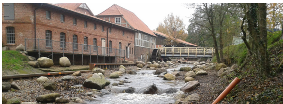
Sohlgleite Oste bei Sittensen

All diese Arbeiten stehen künftig vermehrt im Zeichen der Pflichten des Landes zur Umsetzung der Europäischen Wasserrahmenrichtlinie. Schließlich betreibt der Geschäftsbereich III den Sturmflutwarndienst für das niedersächsische Elbegebiet.