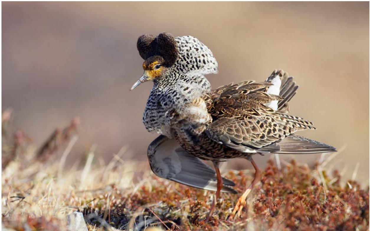
Abb. 1: Kampfläufer