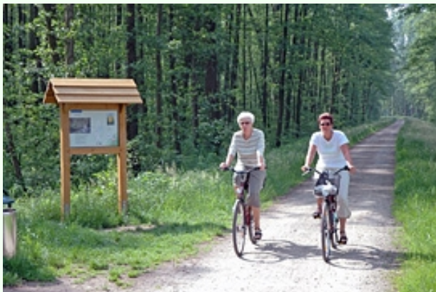
Die Station "Bruchwald" am Westufer

Fahrzeit mit dem Fahrrad: etwa 30 Minuten (ohne Rückweg).