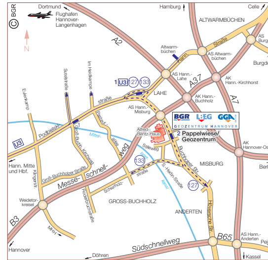
Ab Hauptbahnhof Stadtbahnlinie U3 bis Lahe, Buslinie 127 oder 133 bis Haltestelle Pappelwiese/Geozentrum From main railway station, take tram no. U3 to Lahe, and then bus 127 or 133, bus stop Pappelwiese/Geozentrum

* Müller, U., I. Dahmann, E. Bierhals, B. Vespermann & Ch. Wittenbecher (2000): Bodenschutz in Raumordnung und Landschaftsplanung. Arbeitshefte Boden, Heft 2000/4. Hannover-Vertrieb: E. Schweizerbart * Boess, J., Dahmann, I., Gunreben, M. & Müller, U. (2002): Schutzwürdige Böden in Niedersachsen.