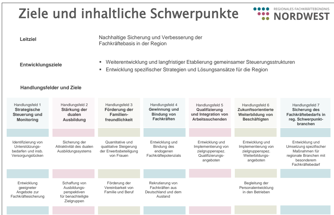
Abbildung 2: Ziele und inhaltliche Schwerpunkte des Regionalen Fachkräftebündnisses Nordwest

Die nachfolgende Abbildung visualisiert die modifizierte Gesamtstrategie des regionalen Fachkräftebündnisses Nordwest mit den Zielen und inhaltlichen Schwerpunkten für den Zeitraum 2015-2020. Das übergeordnete Leitziel besteht weiterhin in der nachhaltigen Sicherung und Verbesserung der Fachkräftebasis in der Region . Der Aufbau gemeinsamer Steuerungsstrukturen, eines der ursprünglich formulierten Entwicklungsziele, ist in den vergangenen Jahren bereits weitestgehend erfolgt. Schwerpunkt soll nun sein, diese Strukturen in der Region bedarfsgerecht weiterzuentwickeln und nachhaltig zu etablieren . Kern der Arbeit im Fachkräftebündnis wird es weiterhin sein, gemeinsam spezifische Strategien und Lösungsansätze für die Region zur Fachkräftesicherung zu entwickeln, zu erproben und zu etablieren.